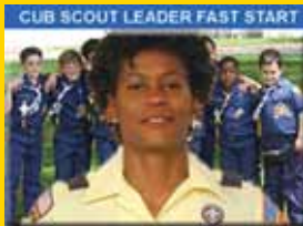
Capacitación Fast Start,