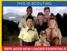
This Is Scouting